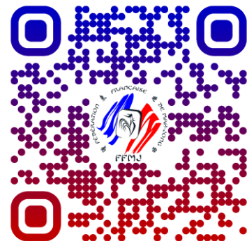
Serveur Discord FFMJ