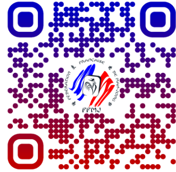
Serveur Discord FFMJ