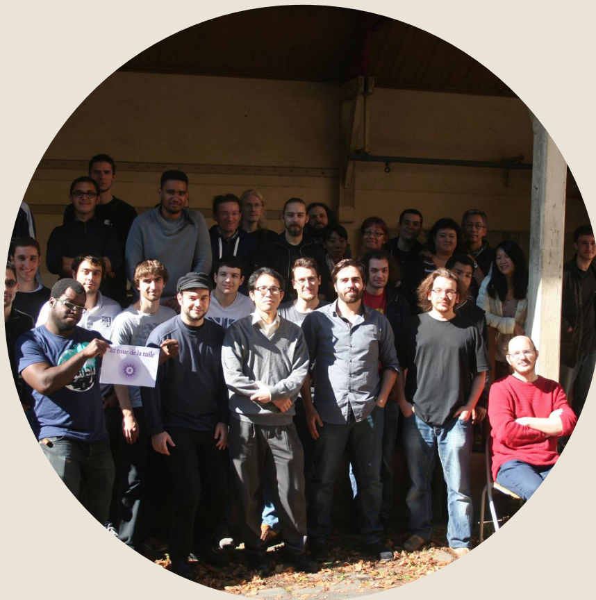
au tour de la tuile 2015