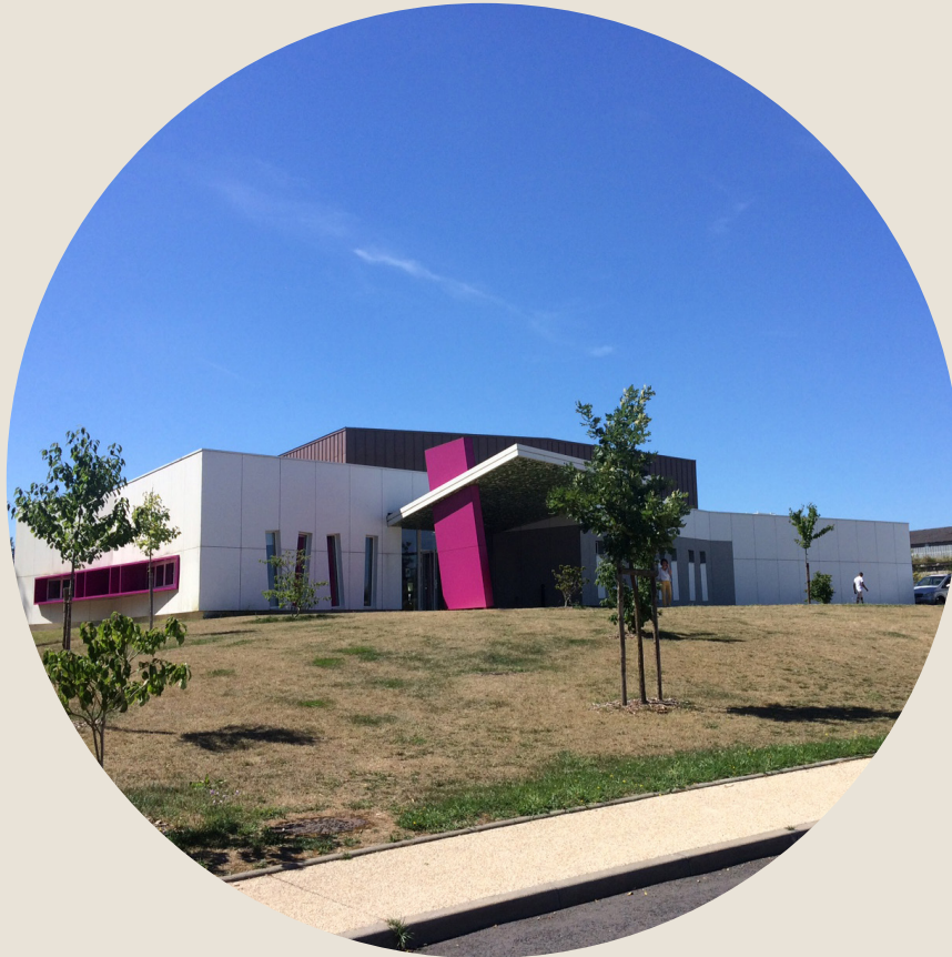
le domaine des loges